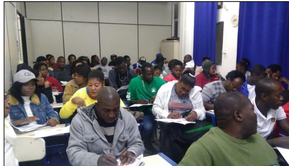
Figura 1 - Curso FIC realizado na cidade de Blumenau-SC

construção e desenvolvimento do projeto, principalmente para observação e aprimoramento das estratégias de ensino. De tal modo, a produção dos conteúdos auxiliará os estrangeiros na familiarização e compreensão da língua portuguesa.